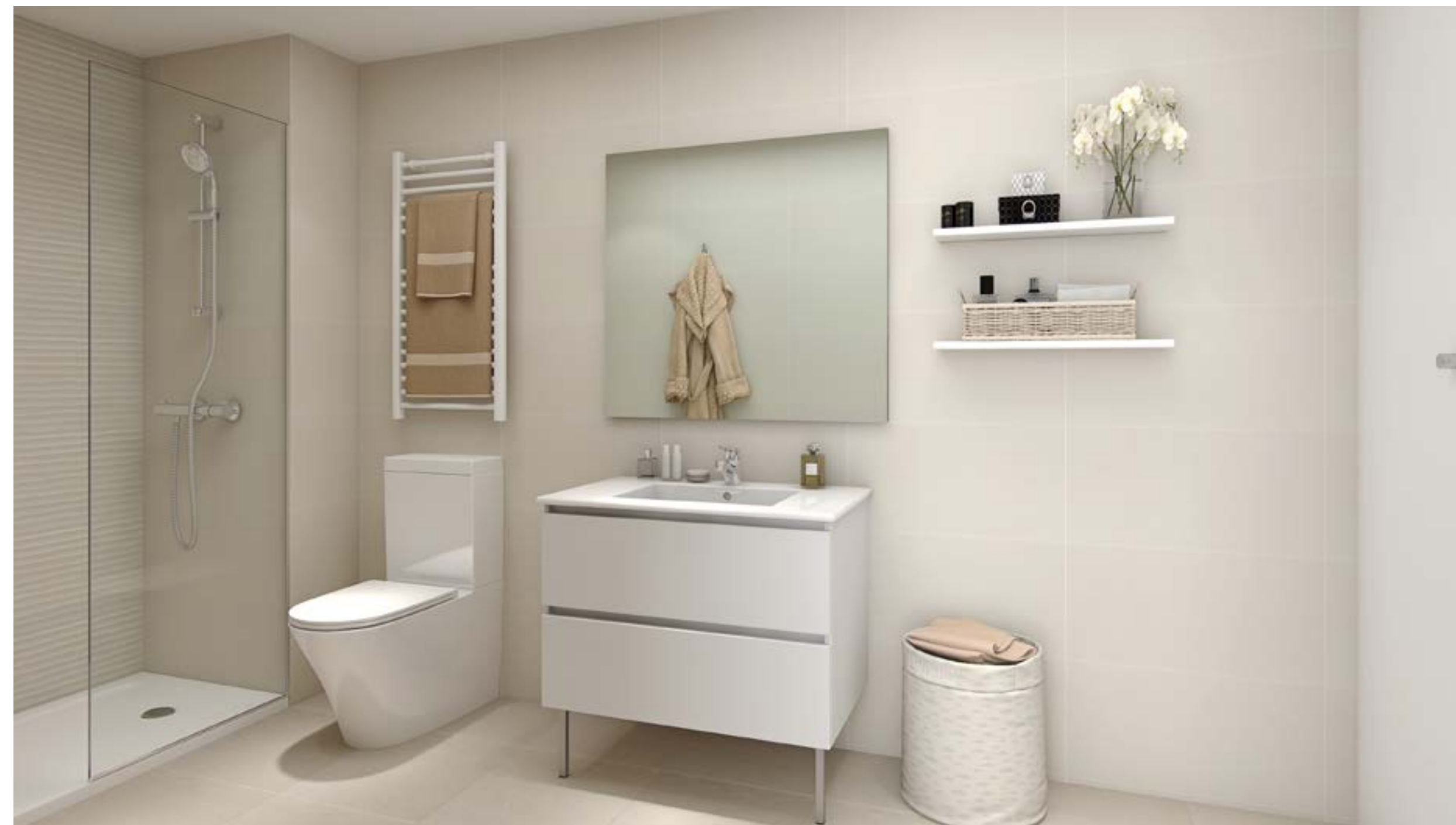
*Recreación virtual no contractual. Consultar acabados en memoria de calidades.