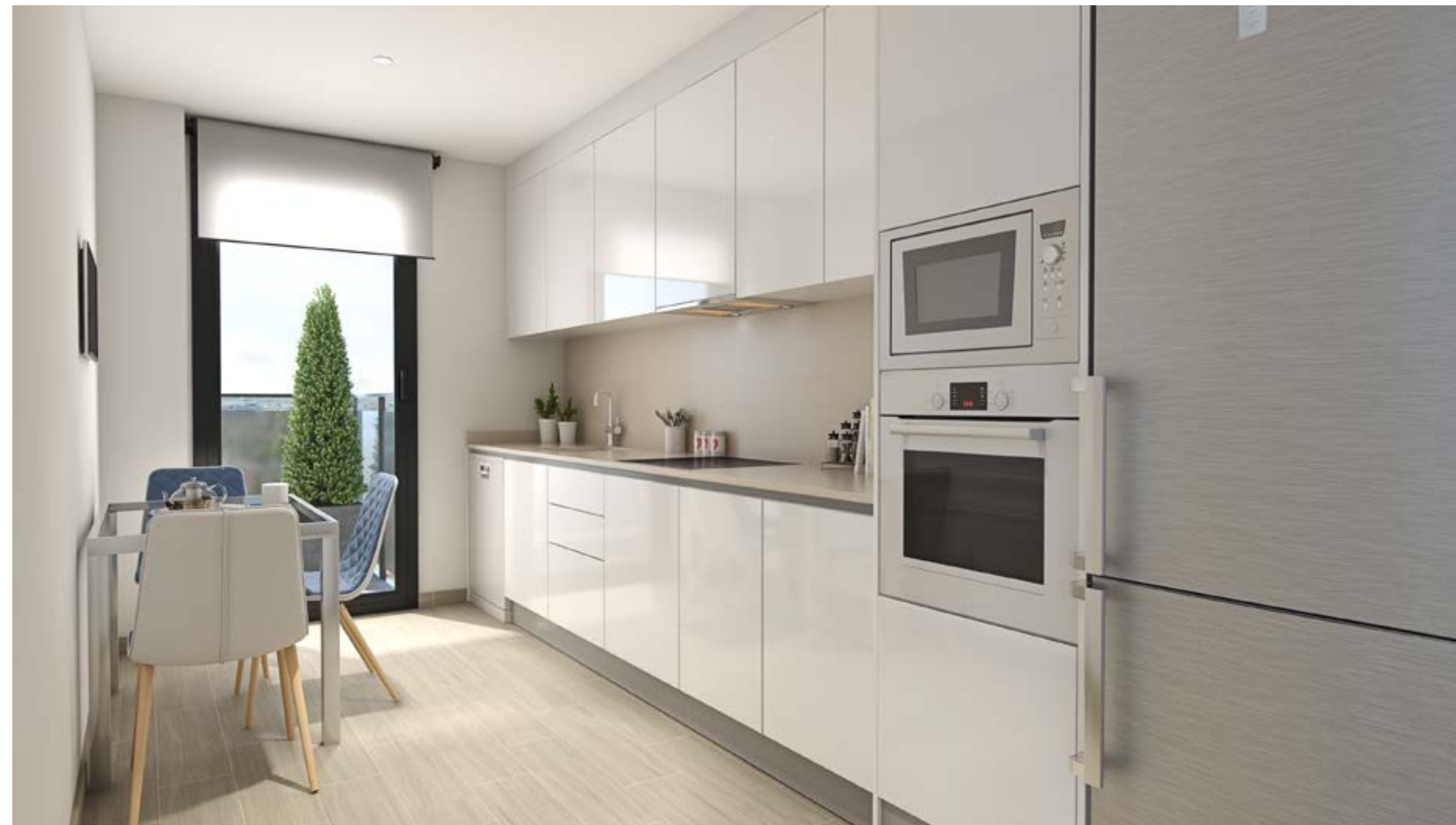
*Recreación virtual no contractual. Consultar acabados en memoria de calidades.