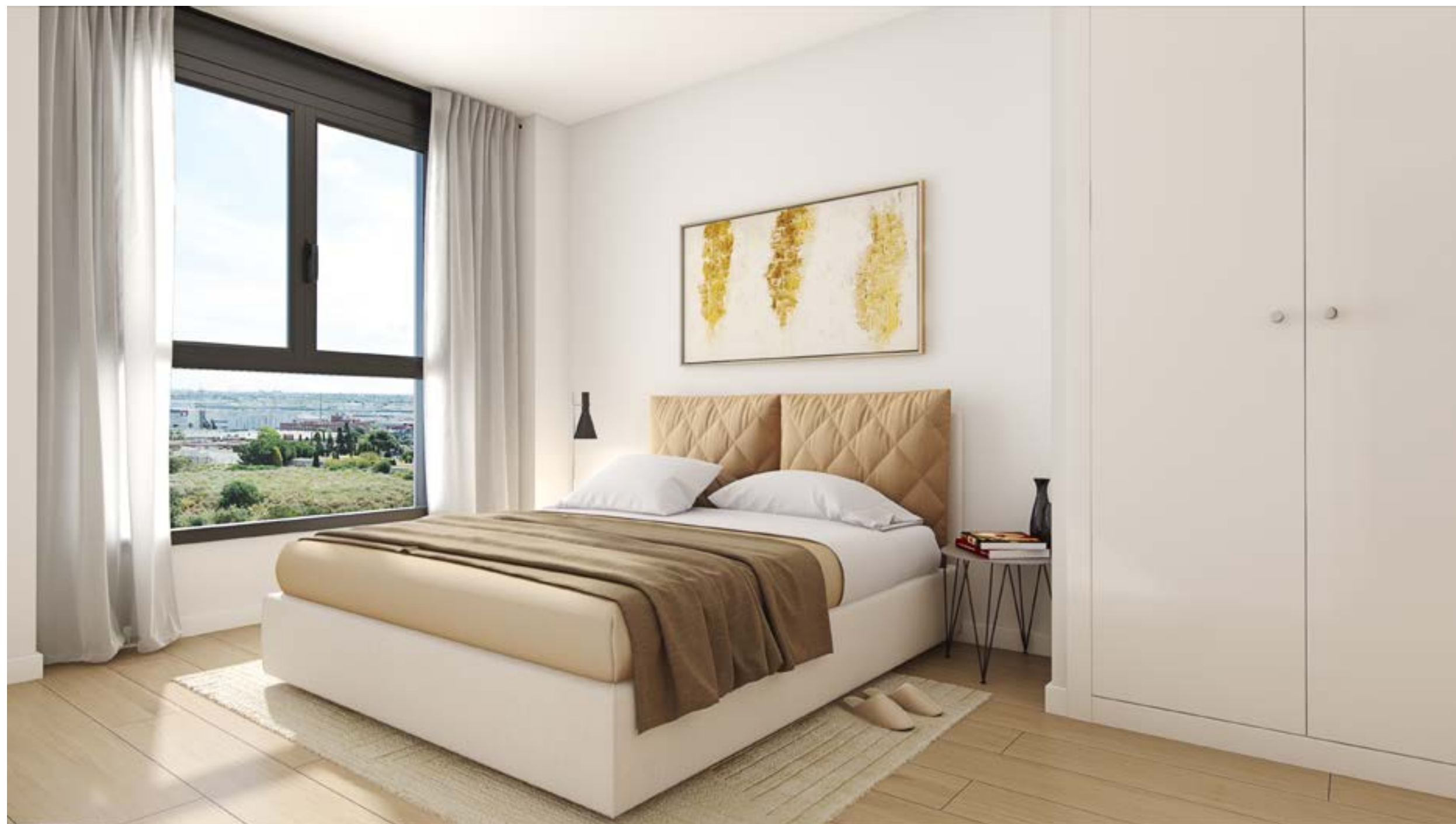
*Recreación virtual no contractual. Consultar acabados en memoria de calidades.