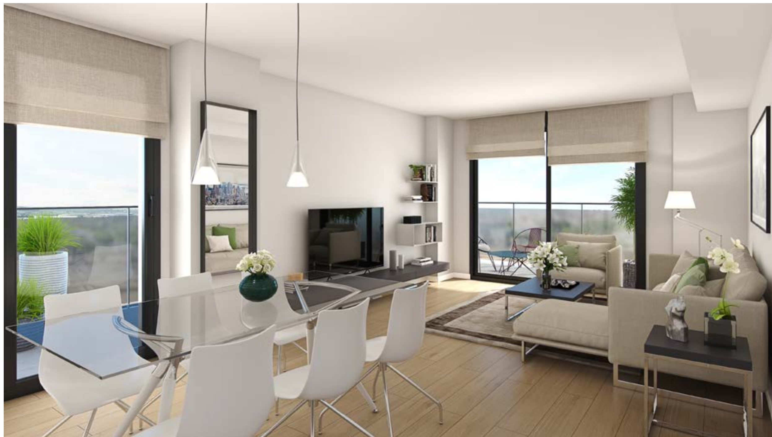
*Recreación virtual no contractual. Consultar acabados en memoria de calidades.